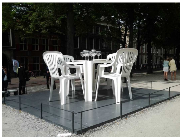
© DR - Courtesy de l'artiste et de la galerie Lange + Pult